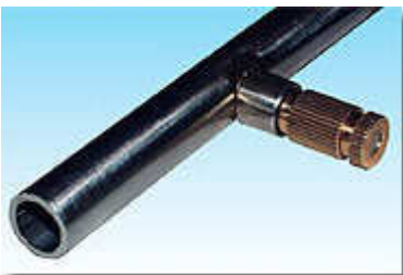
Linea ugelli con ugello