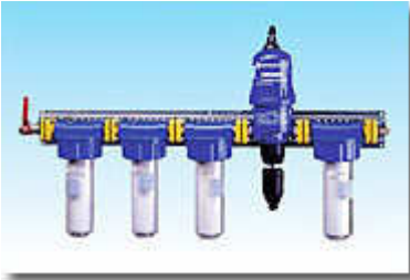
Unità filtraggio con dosatore